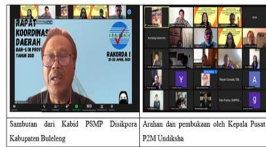
Gambar 2. Kegiatan Pelatihan

Hasil analisis persepsi yang diuraikan di atas didasarkan pada semua langkah kegiatan PKM yang telah diikuti dengan serius, antusias, dan penuh semangat oleh para guru yang ditunjukkan pada bukti foto-foto kegiatan berikut.